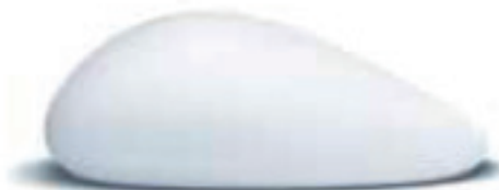
The Matrix™ Dråbeformet implantat.