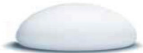
Cristalline™ Rundt implantat.

Round Collection Natural Cohesive Design